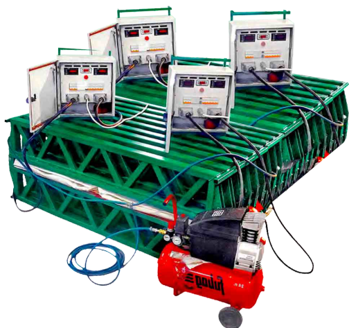
Вулканизатор конвейерный ВК-1500/2000